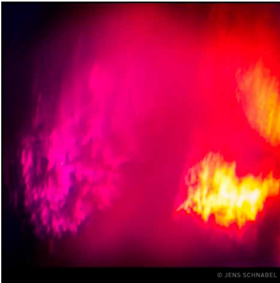
Flammen des Aufstiegs